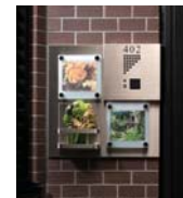
セレクトBタイプ (フォトフレーム)