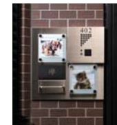
セレクトCタイプ (ハンギングバー)