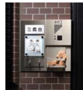
セレクトAタイプ (マルチフック)