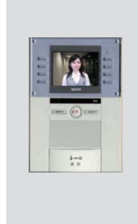
ハンズフリーインターホン