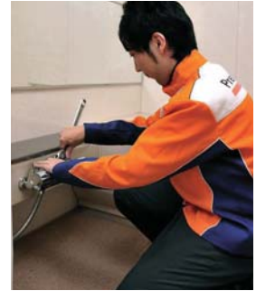
駆けつけサポートサービス (水回りトラブル・鍵紛失等)