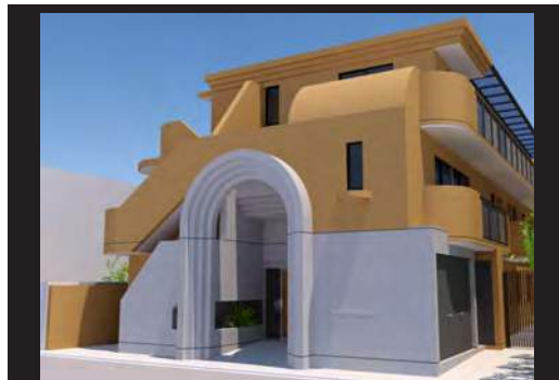
Planning & Presentation